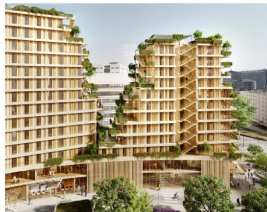
Perspective Projet Synapses