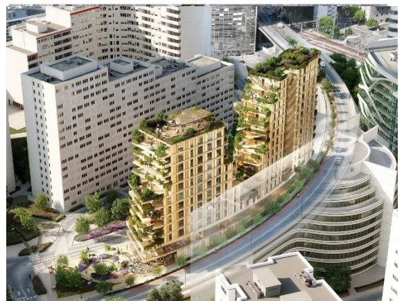
Perspective Projet Synapses