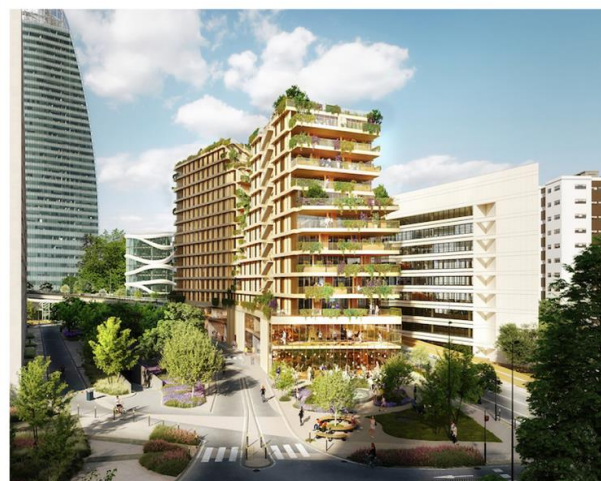
Perspective Projet Synapses