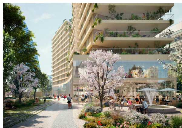
Perspective Projet Synapses

Le projet prévoit le maintien de la maison associative dédiée aux personnes atteintes de la maladie d'Alzheimer à son emplacement actuel. Le paysagiste WALD et le spécialiste en art urbain Quai 36 profiteront du vaste chantier pour repenser son environnement direct. Les différentes animations programmatiques et urbaines de Synapses ont pour objectif également de réactiver le quotidien de ces personnes touchées par la maladie.